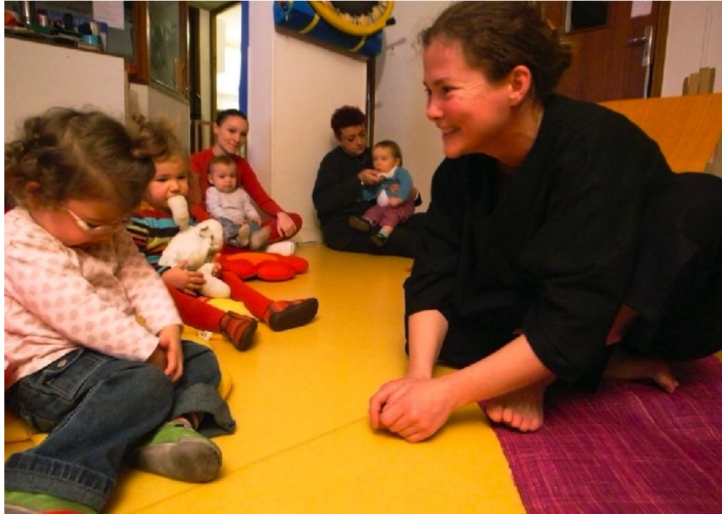
A la crèche « les pieds tendres ».